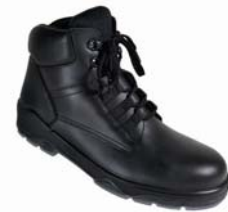
Artikel 98677 S2 Artikel 98687 S3 EN ISO 20345 Gr. 35 - 48