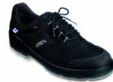
Artikel 98427 S2 Artikel 98437 S3 EN ISO 20345 Gr. 35 - 48